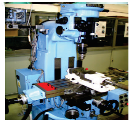
写真-3 立てフライス盤