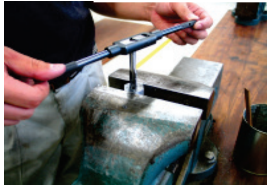
写真－5 タップ立てをしている