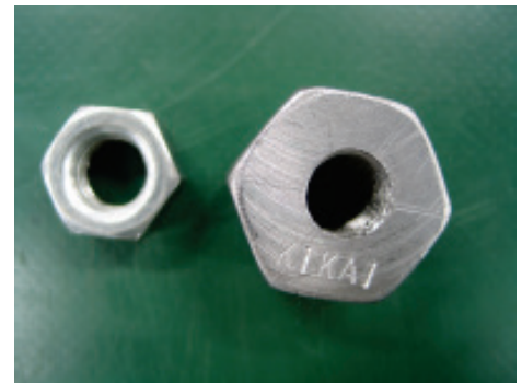
写真－6 ナットの市販品と完成品

写真－6に六角ナットの市販品と完成品を示す。1 個数円のナットでも製作する前と製作してからとでは、レポートの考察・感想文を見るとずいぶんと考え方が変わっていると感じる。実習等で実際に知識を使って体験することで、より認識が深まり知識を積み上げるのに重要な役割を果たしている。