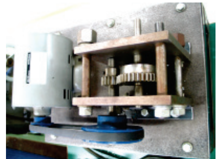
写真-1 組み立てた減速